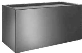
Luca anthrazit 1 , Wahlfarben 2