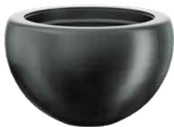
Elena anthrazit 1 , Wahlfarben 2