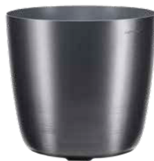
Carmen nieder anthrazit 1 , Wahlfarben 2