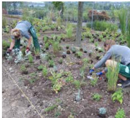
Pflanzung der Stauden