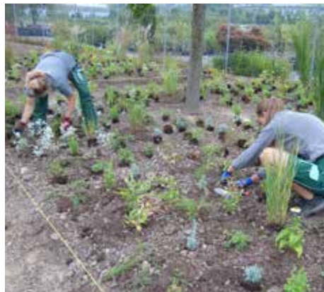
Pflanzung der Stauden