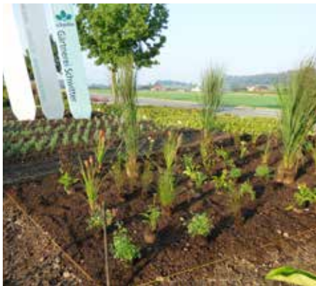
Verteilung der Stauden