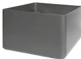
Delta 60 Quadratisch grau 1 , anthrazit 2