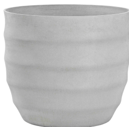
Hive grau 1 , anthrazit 2