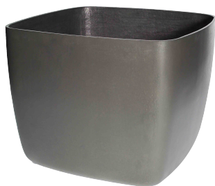
Osaka grau 1 , anthrazit 2