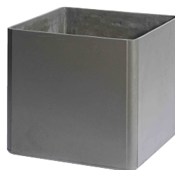
Delta 45 Quadratisch grau 1 , anthrazit 2