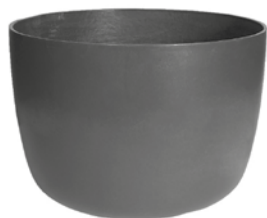
Kyoto low grau 1 , anthrazit 2