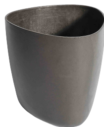
Tokyo grau 1 , anthrazit 2