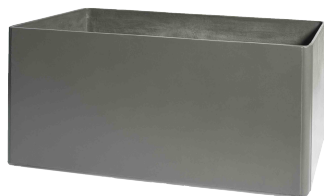
Delta 60 grau 1 , anthrazit 2