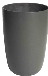
Geisha grau 1 , anthrazit 2