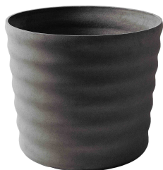
Maia grau 1 , anthrazit 2