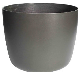
Kyoto grau 1 , anthrazit 2