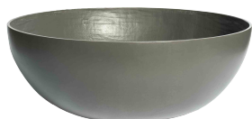
Lausanne grau 1 , anthrazit 2