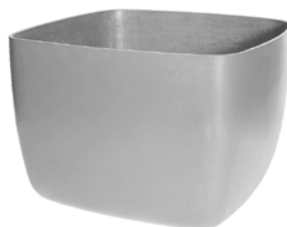
Osaka low grau 1 , anthrazit 2