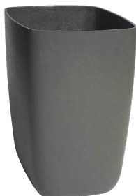
Samurai grau 1 , anthrazit 2