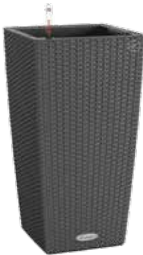
Cubico Cottage granit, sandbraun (lichtgrau auf Bestellung)