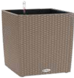
Cube Cottage granit, sandbraun (lichtgrau auf Bestellung)