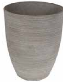
Morley* braun, grau