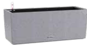
Balconera Stone graphitschwarz, steingrau, sandbeige, quarzweiss