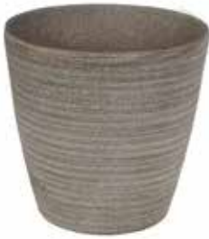
Indus* braun, grau