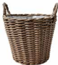
Sevilla braun, grau