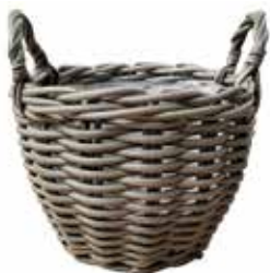
Bilbao braun, grau