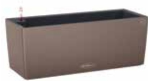
Balconera Color muskat, schiefergrau