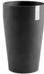
Sankara Medium High dark grey, french taupe