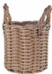
Palma braun, grau