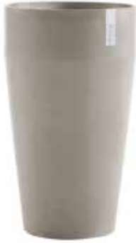
Sankara High dark grey, french taupe