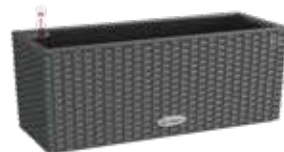
Balconera Cottage granit, sandbraun, lichtgrau