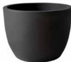
Ares anthrazit, terracotta